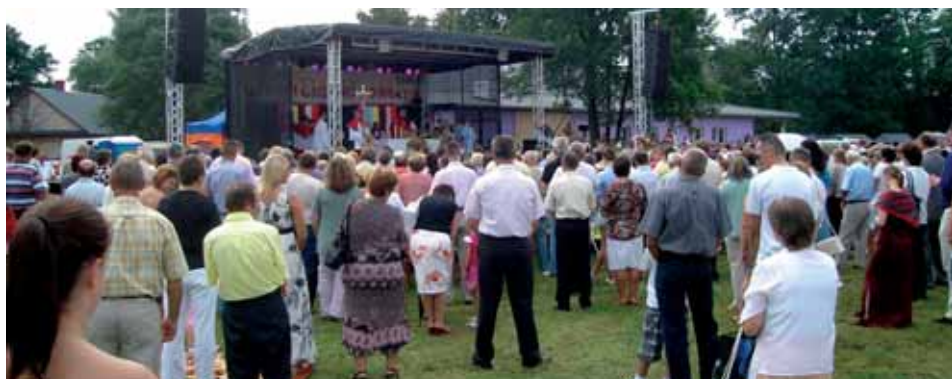
Fot. Ewelina Siola, Piotr Kitaszewicz, Antoni Szymaniak (1)

Dożynki Powiatowo-Gminne w Gliniance odbyły się dzięki następującym organizatorom, współpracownikom, patronom honorowym i medialnym, sponsorom: