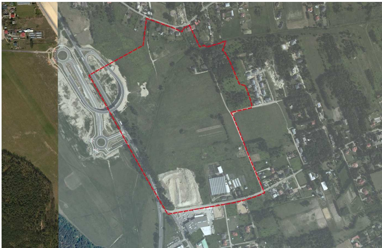
Ryc. 1. Granice obszaru objętego opracowaniem

Dla powyższych wydzieleń określono funkcje oraz wprowadzono szereg ustaleń regulujących użytkowanie terenów, uwzględniając przy tym przepisy z zakresu ochrony środowiska. Integralną częścią planu miejscowego jest rysunek w skali 1:1000.